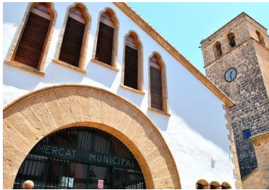
Jávea's historisches Stadtzentrum