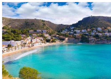
Cala El Portet in Moraira