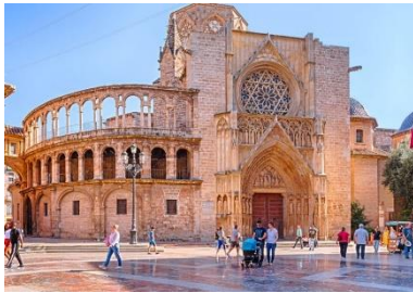
Valencia's historisches Stadtzentrum