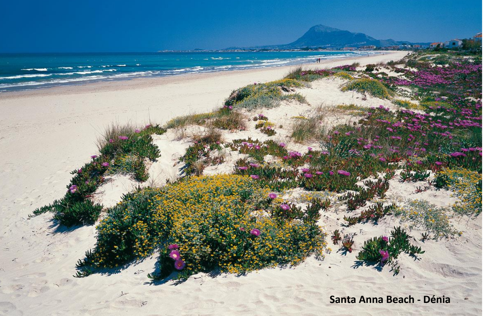
Santa Anna Beach - Dénia