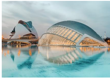
Stadt der Kunst und Wissenschaft