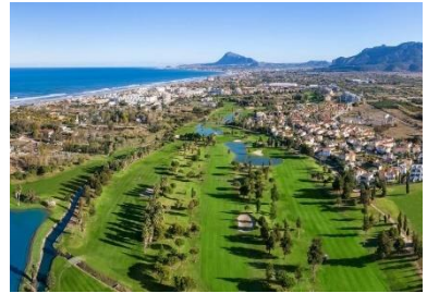
Oliva Nova Golf Resort