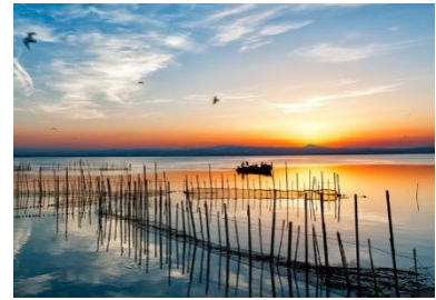
Lagune von Valencia