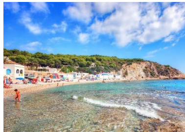
Cala Portitxol in Jávea