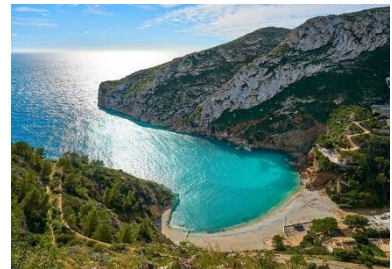
Cala de la Granadella in Jávea